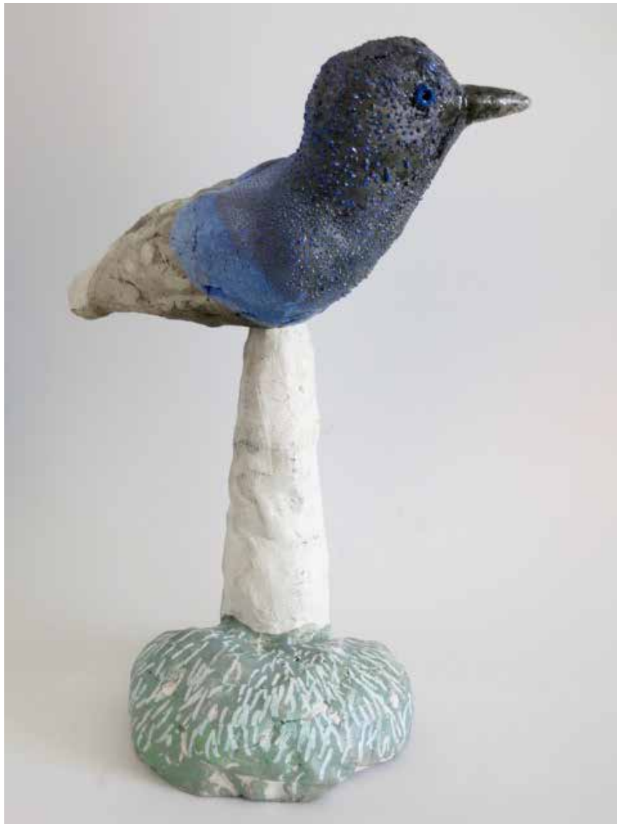
SKULPTUR AV ANNIKA PERSSON